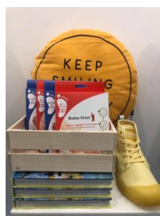
『Folkr』ポップアップショップの様子