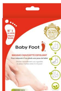
Baby Foot Exfoliating Mask (足の角質ケアパック)

過去には、フランスで唯一“消費者が審査員”となる品質品評会「ヴィクトワール・ドゥ・ラ・ボテ」を2年連続で受賞。本アワードによる「ベビーフット」に対するコメントは、「使いやすい」「驚きの効果」「赤ちゃん肌が戻ってきた」など概ね高い評価で、「この商品があったらまた使うか」という質問に対して、74%の消費者が「使う」と回答するほどの高評価を獲得しました。