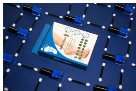
『Folkr』サイト内 「ベビーフット」イメージ画像

Instagramアカウント： https://www.instagram.com/folkr/