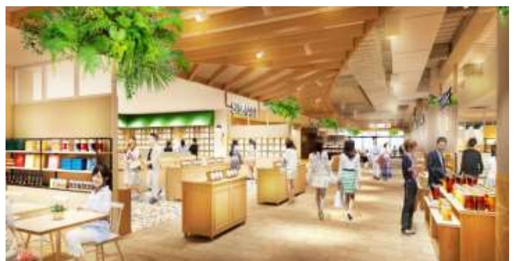
「杜のみなとマルシェ」(イメージパース)