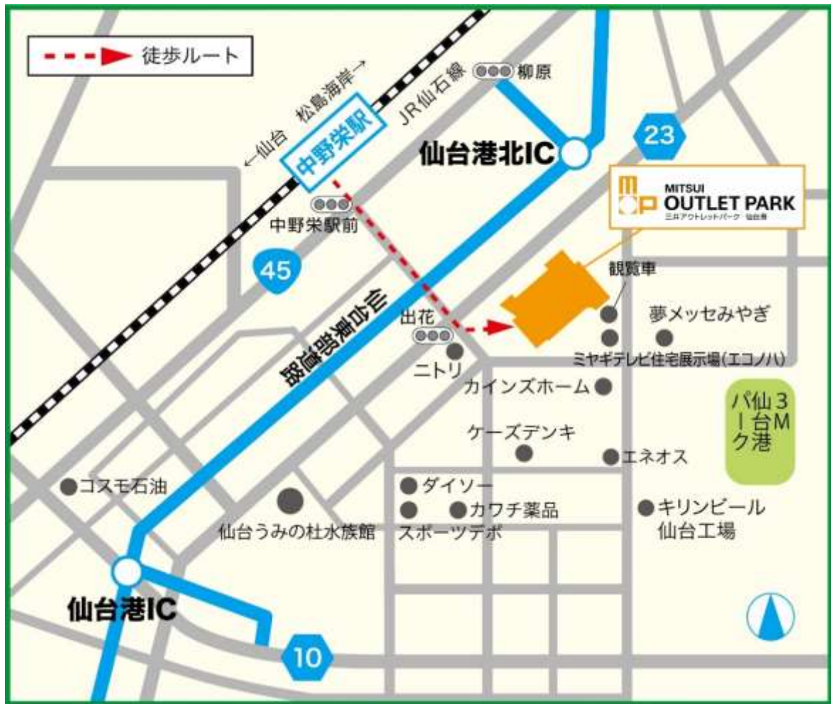
<添付資料 3> 位置図