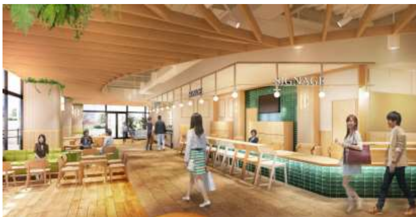
ラウンジスペース・インフォメーションデスク周辺（イメージパース）

「杜のみなとマルシェ」では、お買物の合間にラウンジスペースでゆったりと時間を過ごしたり、天気のよい日はテラススペースでドリンクを楽しんだり、滞在機能の向上に注力しています。またラウンジスペース前のインフォメーションデスクにもお気軽にお立ち寄りください。