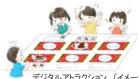
デジタルアトラクション（イメージ）

キッズスペースには、ゲーム感覚で遊びながらお子さまの創造性を刺激するデジタルアトラクションを設置。パパとママも一緒にお楽しみいただけます。