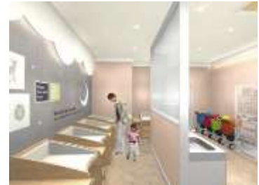
ベビーケアルーム（イメージパース）