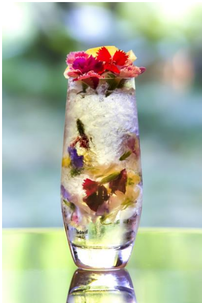
フローラルモヒート

天悠 The Bar & Lounge では、2019年8月31日（土）迄の期間限定で、「モヒートフェア」を開催いたします。5種のモヒートのうちの1つ、新緑、初夏の箱根をイメージしたオリジナルカクテル「フローラルモヒート」は、見た目も華やかに女性に楽しんでいただける、天悠でしか味わえない創作カクテルとなっております。宿の周辺では、つつじ、しゃくなげ、菖蒲や紫陽花など色彩豊かな花を春から初夏にかけてご観賞いただけます。箱根の豊かな自然をカクテルで表現し、バーラウンジから見える景色とともにお客さまにお楽しみいただきたいとの思いから誕生しました。夏のカクテルの代名詞でもある「モヒート」は、ミントによって爽快感を味わえます。エルダーフラワーのリキュールとすっきりしたくせのない甘さと檸檬の酸味、ソーダの爽快感が織りなすハーモニーが女性の心をくすぐる味わいとなっております。1日5杯限定となっております。その他、「メロン」「ベリー」「マンゴー」「ピーチ」と4種のフルーツモヒートは、ノンアルコール、アルコールをご用意しております。果肉たっぷりのフルーツをクラッシュしながらフルーツの甘さを味わっていただけます。ご宿泊のお客さまだけでなく、日帰りのご利用もいただけますので箱根へお出かけの際ご利用ください。