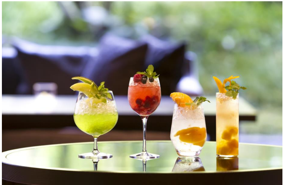
左より メロン、ベリー、ピーチ、マンゴーの4種のフルーツモヒート