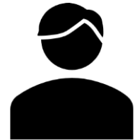
建設会社 S 社様 ご担当者

「 無料で Indeed にも載りますし、求人メディアとセットで原稿作成の手間が省けるっていうのもいいですね。 原稿の修正も追加も簡単にできますし、HP の管理が簡単なのが 1 番ですね。非常にきれいで見やすく、自社で作るよりは『ジョブオブ Lite』の方が効率的に HP を作成できると思います。問い合わせも応募も来ております。」