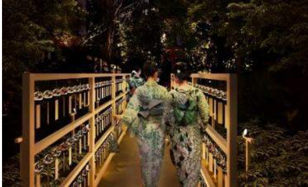
ライトアップイメージ