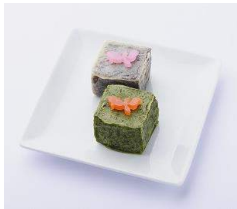
店舗：日本橋 日月堂 名称：冷やし金つば(仮) 価格：430 円(税込)