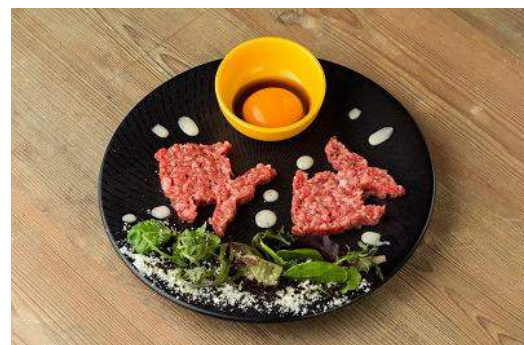
店舗：マンツォヴィーノ 名称：月と金魚 ～極上黒毛和牛ユッケ トリュフ風味～ 価格：1,820 円(税込)