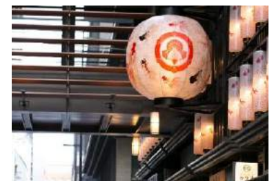
好評の「金魚大提灯」今年も登場

昨年に引き続き仲通りには、『ECO EDO 日本橋 2019』総合プロデューサーである木村英智氏がデザインを監修した、高さ約1.8mの金魚柄の巨大な提灯が登場します。また、仲通りに並ぶ通常サイズの提灯は、日本橋に支店を構える「大日本除虫菊株式会社(金鳥)」とコラボレーション。昨年に引き続き特別にデザインした提灯で、江戸の情緒あふれる夏の装いを演出します。