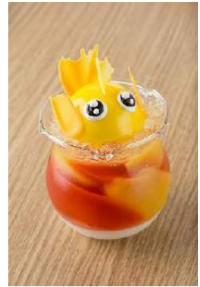
店舗：パティスリー-ISOZAKI 名称：金魚ゼリー 価格：648 円(税込)