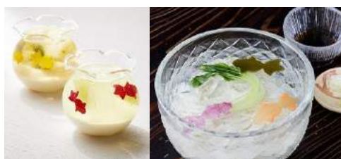
金魚モチーフの限定メニュー

福德神社から福德の森へと続く小径に約200個にも及ぶ江戸風鈴を装飾。風鈴の音で涼を楽しむ空間を演出します。今年初めて夜のライトアップを実施。風鈴がライトに照らされ、更に幻想的でフォトジェニックな空間となります。