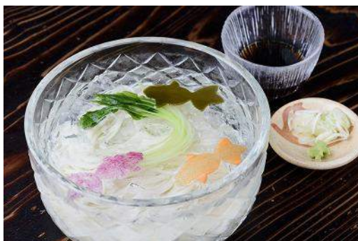
店舗：室町 砂場 名称：氷うどん 価格：大 918 円 小 702 円(税込)