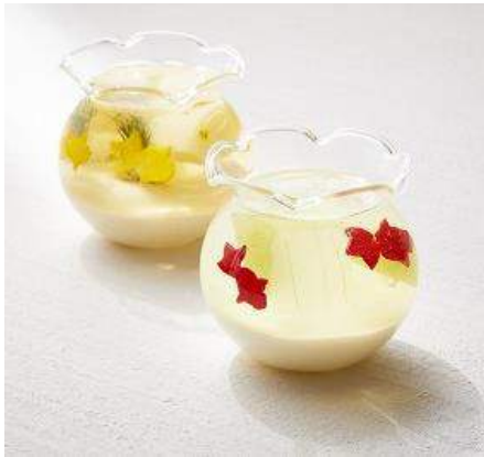
店舗：ザ マンダリン オリエンタル グルメショップ 名称：左:金魚ジョーヌ、右:金魚ルージュ 価格：各 864 円(税込)