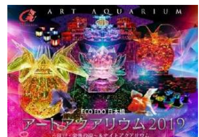
ECO EDO 日本橋 アートアクアリウム 2019 メインビジュアル