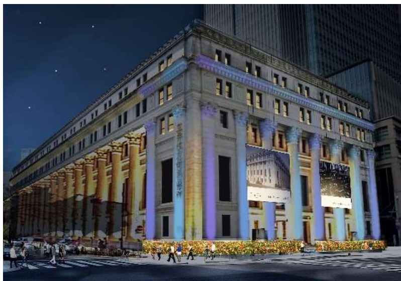
「三井本館」外観装飾 イメージパース

また、期間中は三井本館の外壁にホンマ氏による 8.4 メートル四方の巨大写真を 2 枚掲出します。これらは、三井本館の 90 年前の姿で、当時の過去の写真をホンマ氏の視点で独自に再撮影されたものです。さらに作品の足元では、三井本館 90 周年を祝う色とりどりの花が建物の周囲を装飾し、梅雨から夏に向けての日本橋を美しく彩ります。日没から 23 時までには、光を用いたアートを多く手掛ける美術家高橋巨太氏のデザインによるライトアップが施され、夜の重要文化財の姿もお楽しみいただけます。