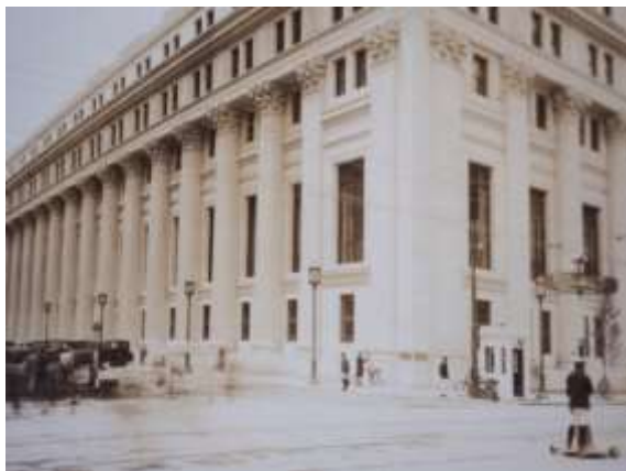
開館当時の三井本館