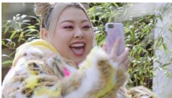
「突撃!架純ちゃん家」篇 https://www.youtube.com/watch?v=hyiobf_pFCA