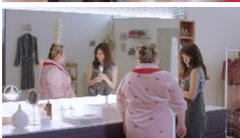
「パパパンパッティング」篇 https://www.youtube.com/watch?v=KCnfg3yO5eU