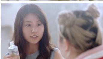
「バシャーんですっぴん」篇 https://www.youtube.com/watch?v=itaVrWsxwkE&t=64s