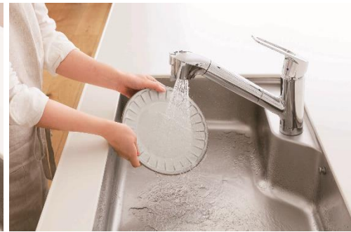
食洗器に入れる前の予洗いに