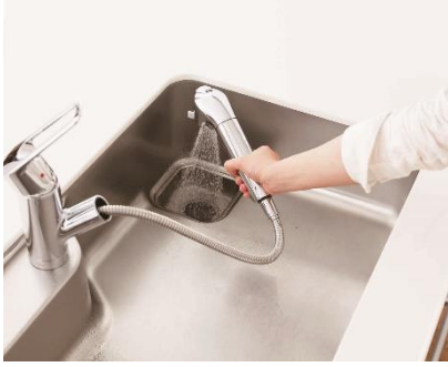
排水口のヌメリ防止に