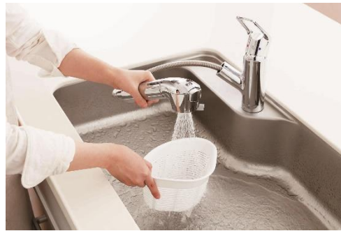
網目の隙間汚れに