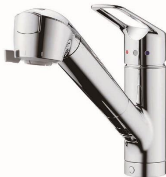
クリーンシリーズ (JL3)

株式会社タカギ(所在地:福岡県北九州市小倉南区石田南 2-4-1、代表取締役社長 高城 英一郎 以下、タカギ)は2019年6月3日(月)より、蛇口一体型浄水器として新シリーズとなる「クリーンシリーズ (JL3)」を新発売いたします。また、GOOD DESIGN AWARD2018 を受賞し、スタイリッシュなデザイン性と機能性で好評を博している新築市場向けに発売中の「クローレ (JY2)」も、リフォーム市場向けの仕様にして取り扱いを開始いたします。さらに新商品発売を記念したキャンペーンも同年7月1日(月)より開催いたします。