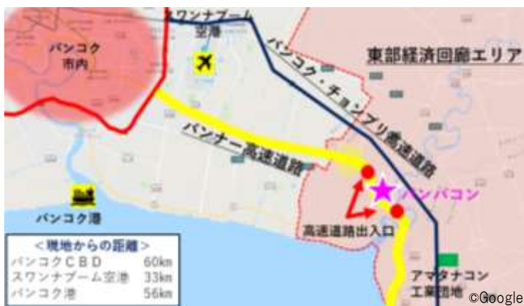
バンパコン位置図