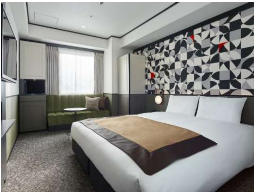
モデルートダブル

近年のレジャーニーズに対応する為、客室構成を大幅に見直し、シングルタイプを減らし、ダブルタイプを10室、ツインタイプを27室、トリプルタイプを23室増やしました。また、客室内装は腰板や廻縁などのフォーマルなモチーフ、パターン、フォルムを随所に配し、オリーブグリーンやワインレッドなどのイタリアならではの伝統色をベースとした落ち着いたカラースキームでまとめ上げました。ヘッドボード上のアクセントクロスには、黄金比螺旋をモチーフとしたオリジナルデザインを採用し、イタリアンレッドやゴールドのオブジェを配することで、おとなの遊び心を散りばめました。落ち着いた中に、遊び「心」のある「おとなイタリアンスタイル」の滞在空間をお客様に提供いたします。