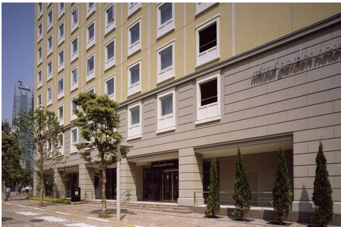
三井ガーデンホテル汐留イタリア街