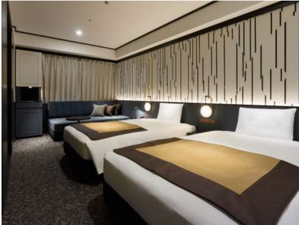
スーパーアツイン (3名対応)