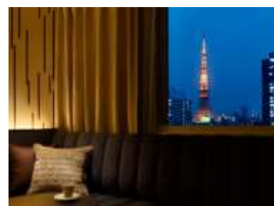
スーペリアツイン(東京タワーVIEW)からの眺め