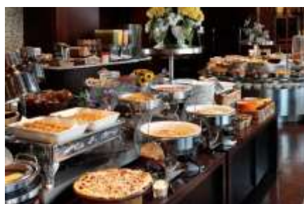
朝食ビュッフェ(一例)