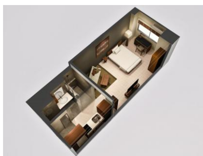
【スーペリアルーム】