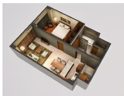
【エグゼクティブルーム】