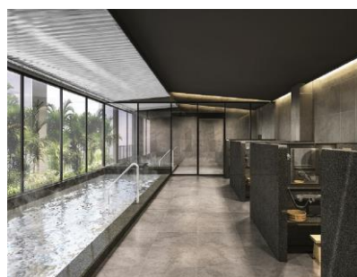
【露天風呂付大浴場】