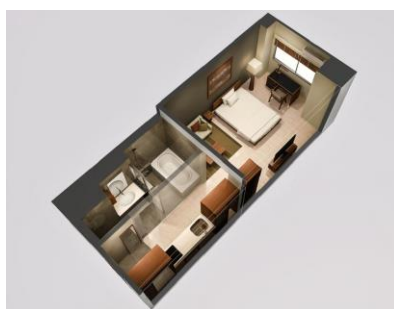
【デラックスルーム】