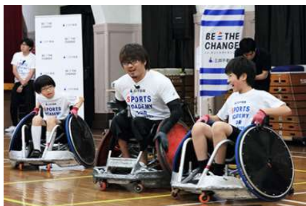
第8回/ウィルチェアーラグビーアカデミー