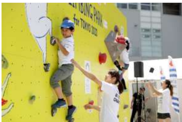
第7回/クライミングアカデミー