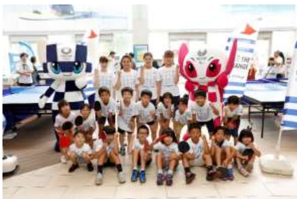
第14回/卓球アカデミー