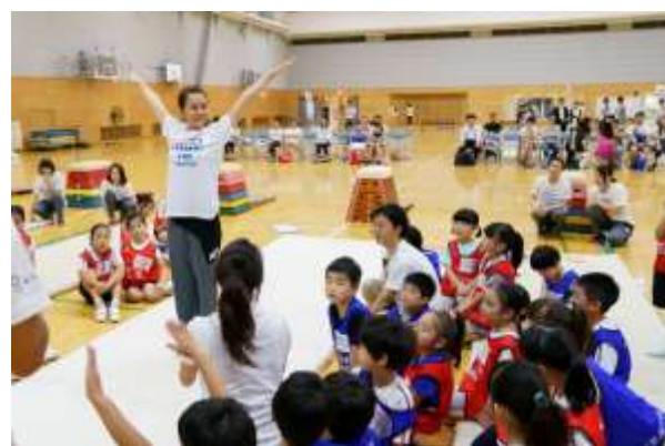
第9回/体操アカデミー