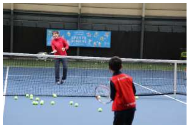
第15回/テニスアカデミー