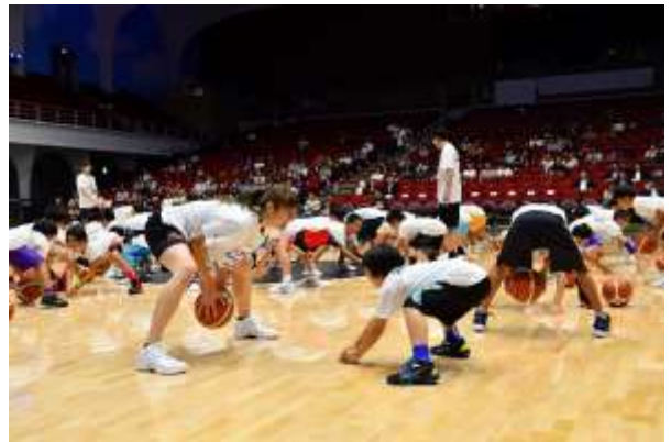
第10回/バスケットボールアカデミー