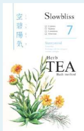
サニーマインド7パッケージ画像