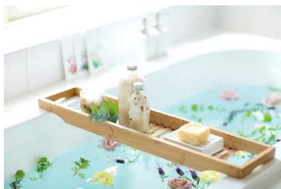
サニーマインド7イメージ画像

https://slowbliss.jp/bath/product/detail.html?bn=10