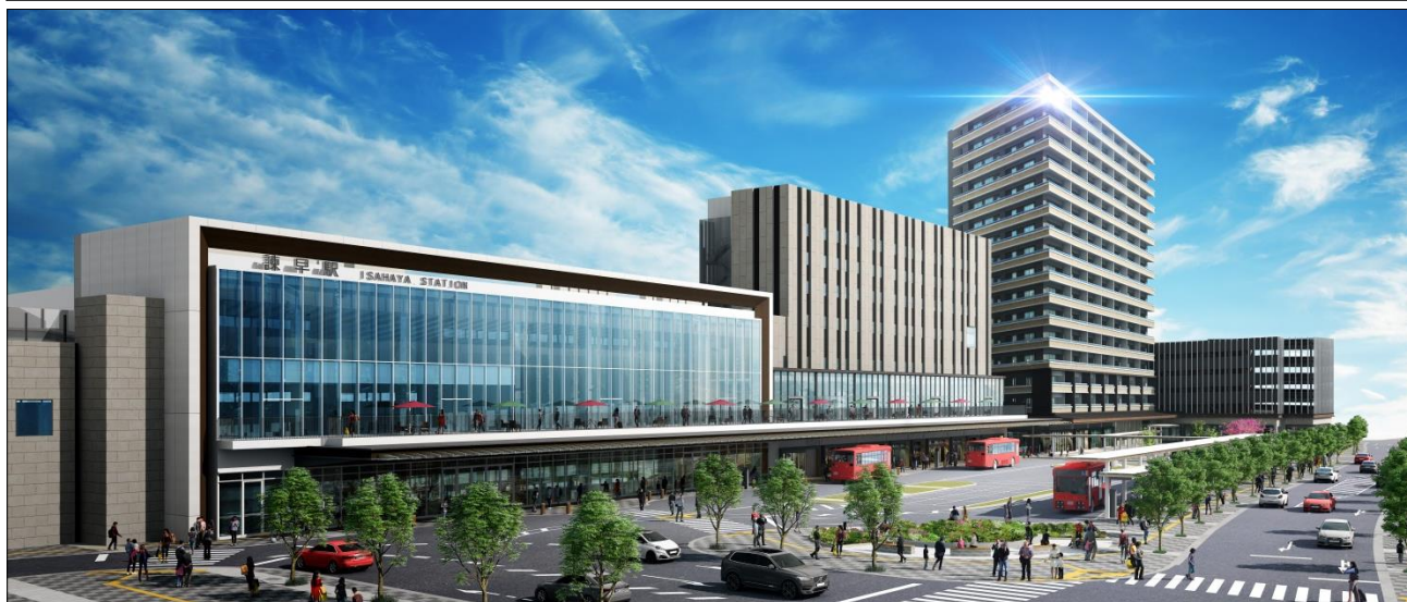
※「諫早駅東地区第二種市街地再開発事業」完成予想図（諫早バスターミナル側からの眺め）

※右から2番目の建物（最高層の建物）が「ライオンズ諫早ステーションスクエア」。1番右の建物はライオンズ諫早ステーションスクエアの自走式駐車場。