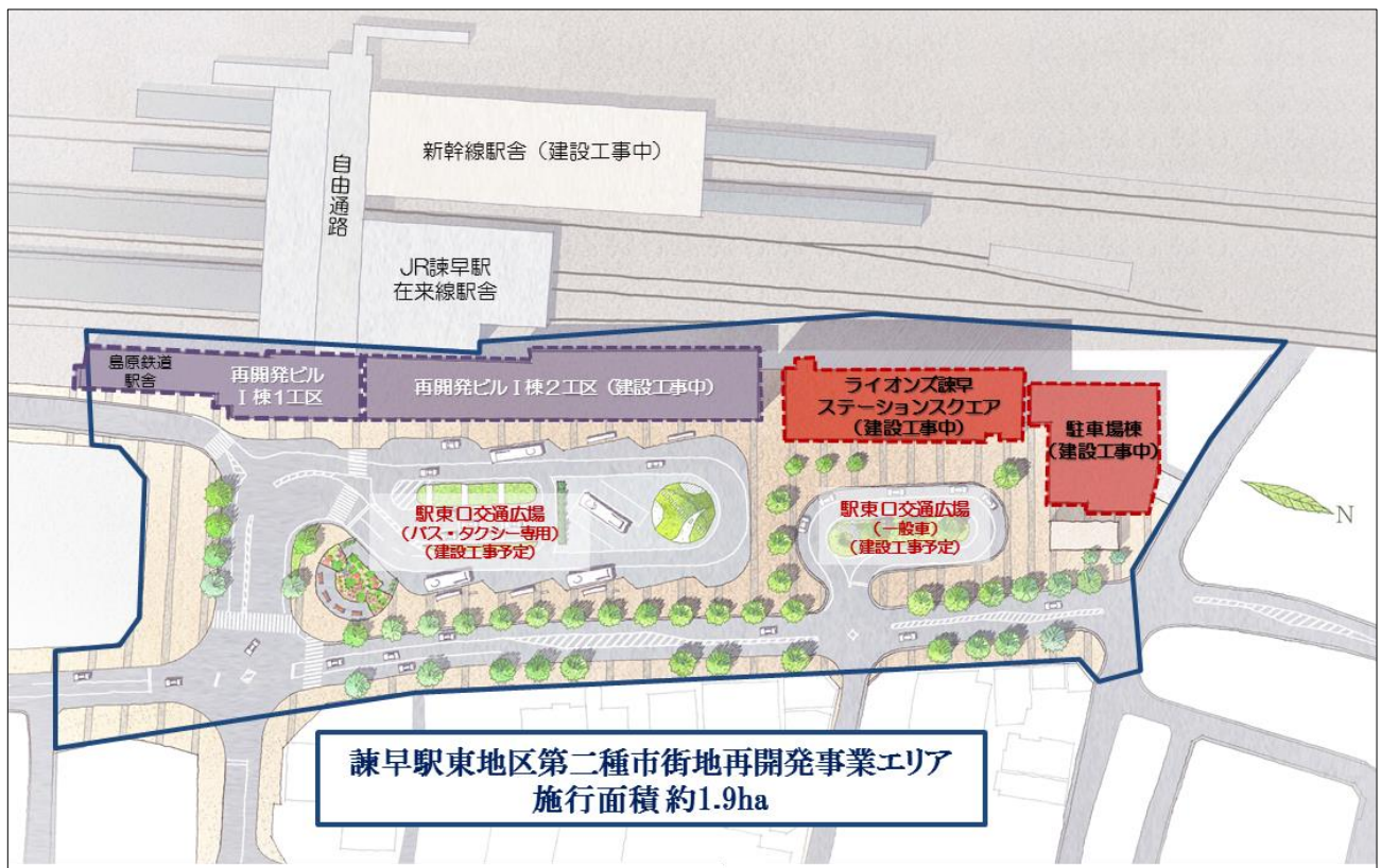
※「諫早駅東地区第二種市街地再開発事業」完成予想図

このうち、Ⅱ棟の居住部分を「ライオンズ諫早ステーションスクエア」として分譲する予定です。当該再開発事業を通じ、都市機能の整備を促進し、交流とにぎわいのある都市環境の創出に貢献してまいります。