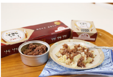
▲完成した発酵バター入りコンビーフ