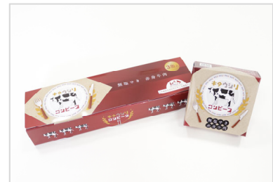
▲第1期で制作したパッケージ