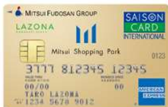
ラゾーナ川崎プラザカード 《セゾン》