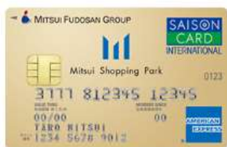
三井ショッピングパークカード 《セゾン》