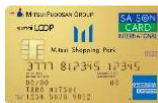
三井ショッピングパークカード 《セゾン》 LOOP ゴールド