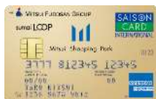
三井ショッピングパークカード 《セゾン》 LOOP