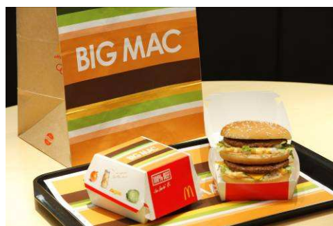
[パッケージ、手提げバッグ、トレイマット(採用イメージ)]

審査員 — 水野学(アートディレクター)、スプツニ子!(現代アーティスト)、 小山登美夫(ギャラリスト)、岩淵貞哉(美術手帖編集長)、輪派絵師団(アート集団)