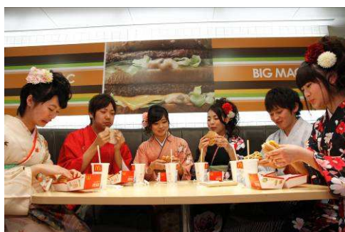
[店舗装飾(採用イメージ)]