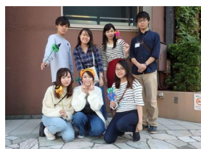
モザイクアートの写真撮影をしたゼミ生