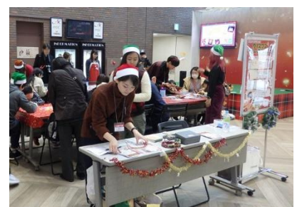
クリスマスワークショップの様子