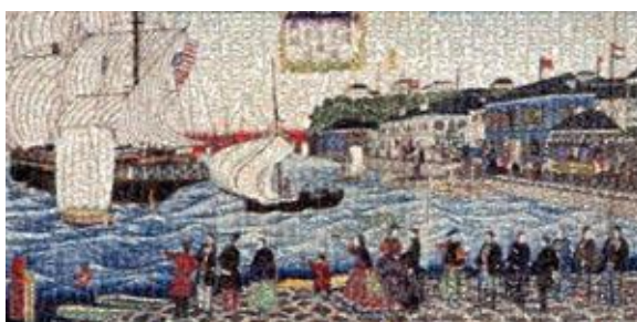
今年度展示したモザイクアート