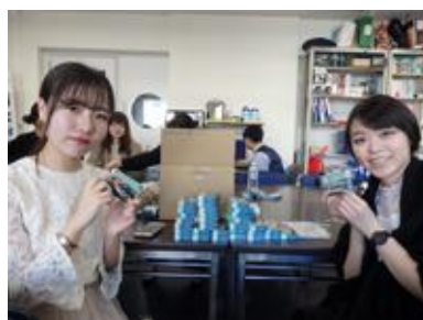
トランプのパッキングをする学生