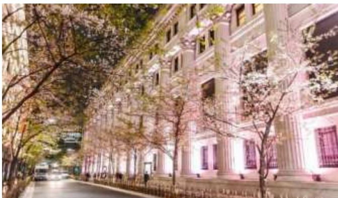
「三井本館」ライトアップ 過去の様子

日 時：3/15(金)～4/7(日) ※点灯時間は施設によって異なります。 場 所：江戸桜通り、OVOL 日本橋ビル、コレド室町1・2・3、東京八重洲口グランルーフ、東京建物日本橋ビル、日本橋高島屋 S.C.日本橋ギャラリー、日本橋三井タワー、日本橋三越本店、三井本館、YUITO 他