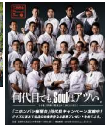
「何代目キャンペーン」メインビジュアル

日時：3/30(土)、3/31(日) 12:00～18:00 ※なくなり次第終了