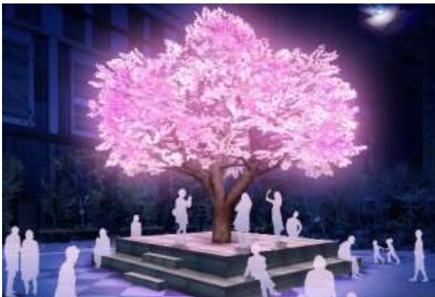
①The Tree of Light -灯桜-