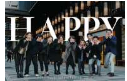
記念写真イメージ

日 時：4/5(金) 場 所：仲 通 り 13:45～15:30 福徳の森 16:00～18:00 仲 通 り 18:30～20:00