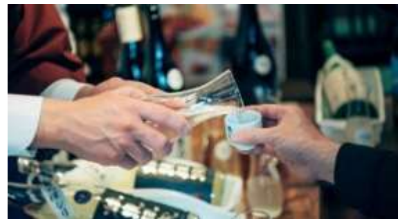
日本橋エリア 日本酒利き歩き 過去の様子