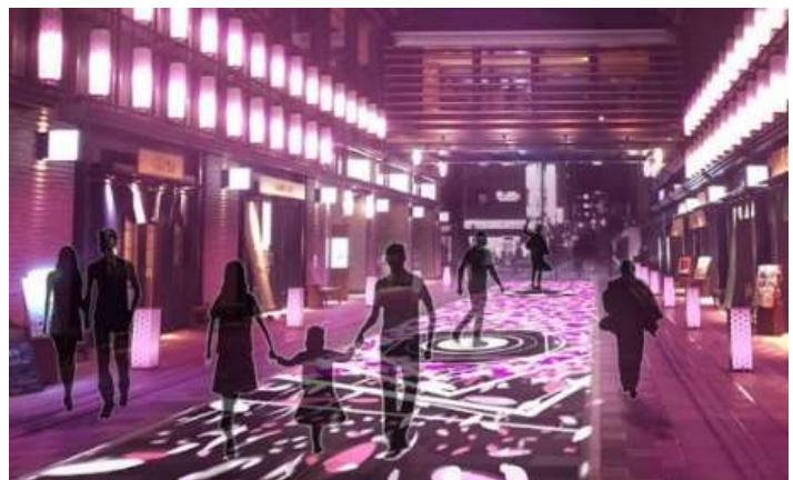
②サクラカーペット