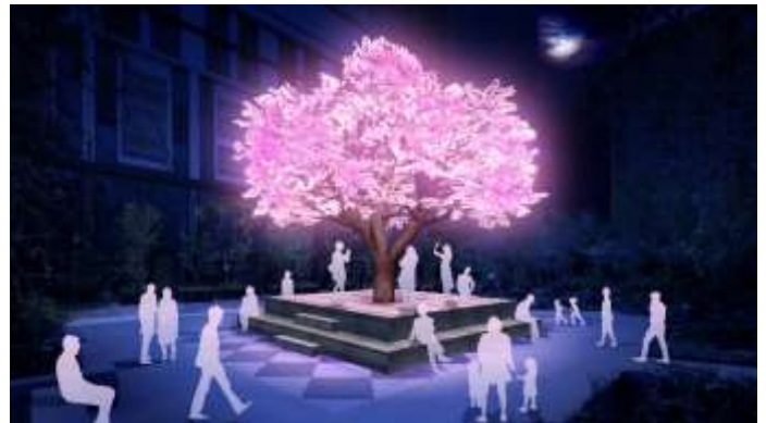
ともしざくら The Tree of Light- 灯桜 -

日 時：3/15(金)～4/7(日) 点灯時間：16:00～20:00 場 所：福德の森 主 催：三井不動産株式会社 共 催：The Tree of Light Japan