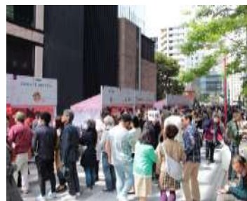
昨年の「ニホンバシ桜屋台」の様子

また今回は、出店店舗の店主が何代目かを当てる「何代目キャンペーン」というクイズ施策を実施します。三四四会店舗の紹介がヒントとなっており、クイズを楽しみながら各店舗の歴史についても知ることができます。また、クイズに答えて参加いただける抽選会では、三四四会加盟店にて使えるお食事券などが当たります。