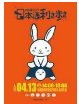
第7回「日本橋エリア 日本酒利き歩き 2019」 メインビジュアル

日 時：4/13(土) 14:00～18:00 場 所：日本橋エリア 受付時間：前売り受付 13:00～15:30、当日受付 14:00～15:30 受付場所：新川屋 佐々木酒店、ダリア食堂、日本橋案内所 料 金：前売りチケット 3,000 円(税込)、当日チケット 4,000 円(税込) ※飲食代別途、チケットは予定枚数に達し次第終了 チケット販売：新川屋 佐々木酒店、ダリア食堂、日本橋案内所 ※前売りチケットは上記以外にイープラスにて販売中 主 催：日本橋日本酒プロジェクト W E B： http://www.sasas.jp/