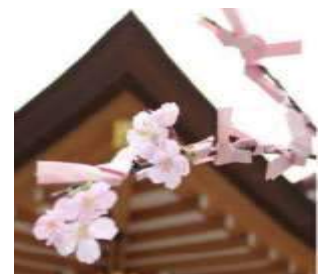
桜みくじイメージ