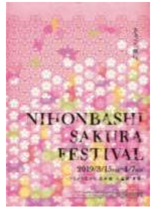
日本橋 桜フェスティバル 2019 メインビジュアル

協 賛：ソニーPCL 株式会社、日本コカ・コーラ株式会社、コレド日本橋、 コレド室町 1～3、東京ステーションシティ運営協議会、東京建物株式会社、 日本土地建物株式会社、日本橋高島屋 S.C.、日本橋三越本店、 日本橋三井タワー、マンダリン オリエンタル 東京、三菱地所株式会社、 安田不動産株式会社、YUITO 野村不動産株式会社、 東京・春・音楽祭実行委員会、岡西佑奈アートプロジェクト'真言'製作委員会、 濱田酒造株式会社、キヤノン株式会社 他