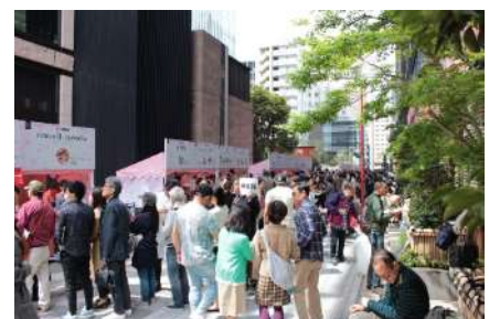
④「日本橋桜メニューウォーク」にて提供予定の桜メニュー