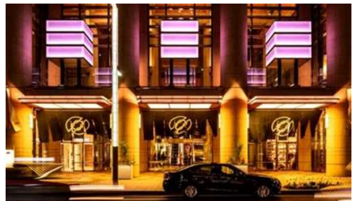
「日本橋三井タワー」ライトアップ 過去の様子