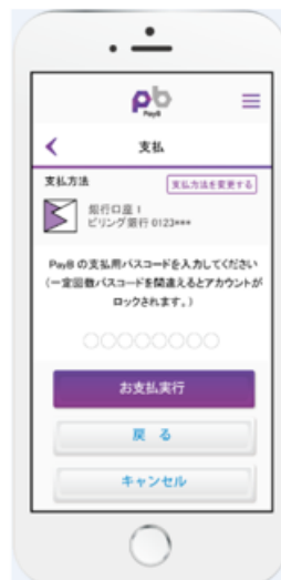
③パスコードを入力する