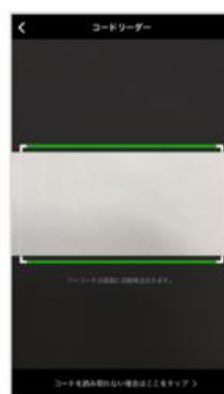
③立ち上がったコードリーダーで お手元のバーコードを読み込む