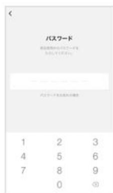
⑥パスワードを入力する