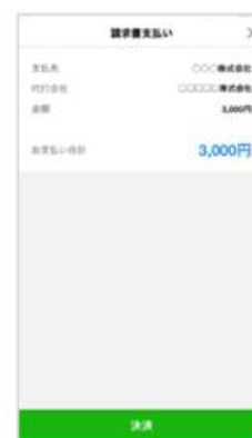
④請求内容を確認する