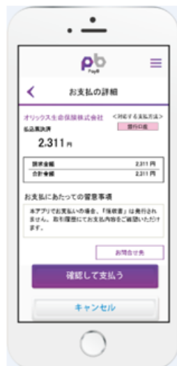
②請求内容を確認する