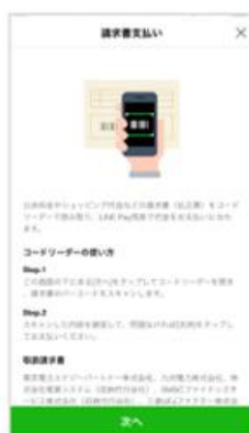
②内容を読んで「次へ」