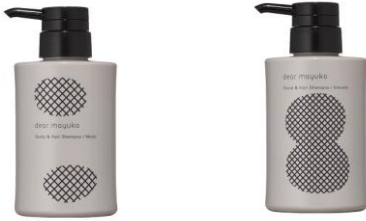
スカルプ&ヘアシャンプー（スムーズ/モイスト） 300mL 3,800円+税