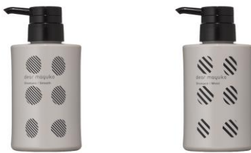
シャンプー（スムーズ/モイスト） 300mL 2,800円+税