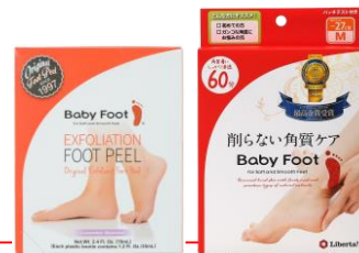
アメリカ版パッケージ 日本版パッケージ