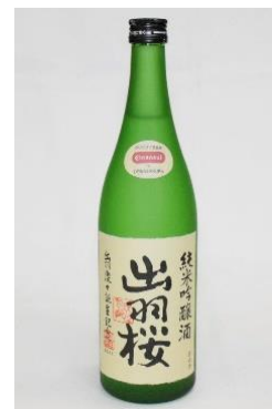
『出羽桜 純米吟醸酒 Cleansui 仕込み(瓶火入)』