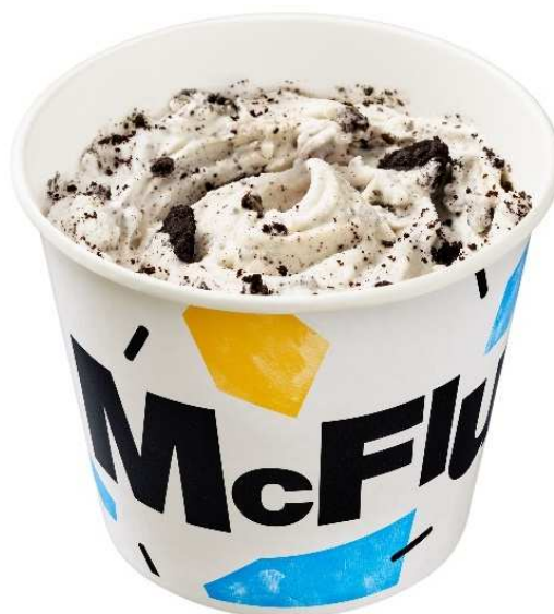
【マックフルーリー オレオ®クッキー】