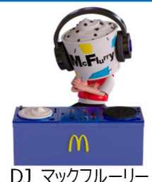
DJ マックフルーリー

今回の TVCM から、「マックフルーリー」の特長である「食感」と「ミックスして楽しむ」をより多くのお客様にお伝えするため、新キャラクター「DJ マックフルーリー」が登場いたします。また、今後販売する「マックフルーリー」の TVCM には次の「マックフルーリー」のヒントが隠されているので、商品を予想いただきながら、ご覧ください。