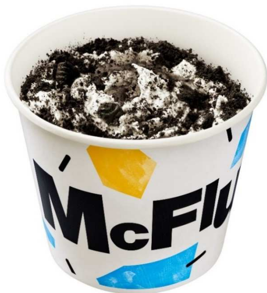
【マックフルーリー 超 オレオ®】

販売時間 - 午前10時30分～閉店まで(24時間営業店舗では翌午前1時00分まで)