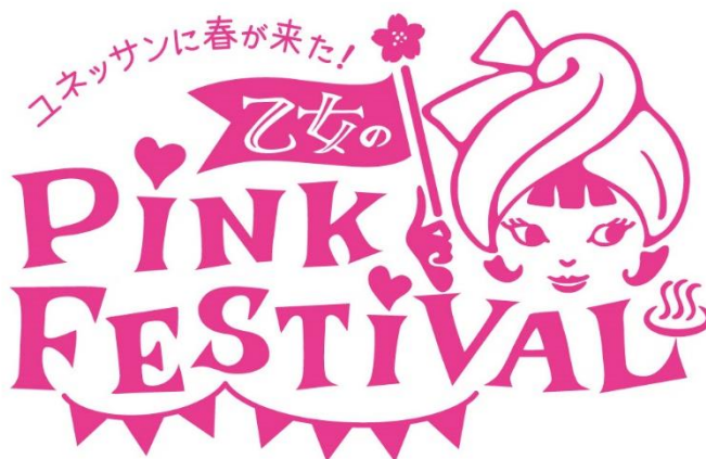
▲「乙女の PINK FESTIVAL」ロゴ

【URL】 https://www.yunessun.com/spring_2019/