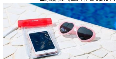
▲スマートフォン用防水ケース(1,730 円)