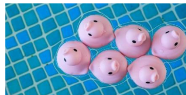
▲「ボザッピーの湯ウ遊広場」のアヒル