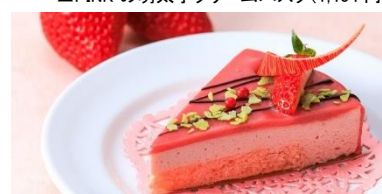
▲PINK のルビーチョコレートムース(500 円)