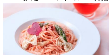
▲PINK の明太子クリームパスタ(1,404 円)