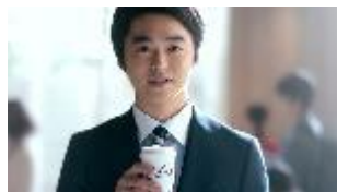
サラリーマン男性客 NA: この笑顔を見たいから？