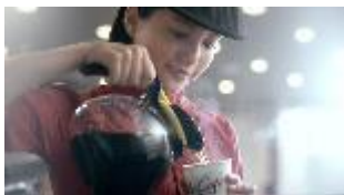
サラリーマン男性客 NA: 今日もマックに 来ちゃうのは...