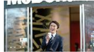
サラリーマン男性客 NA: どっちもかな~