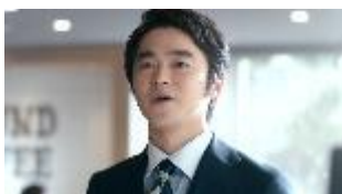
サラリーマン男性客 NA: 美味しいコーヒーを 飲みたいから？