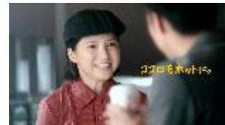
NA: ココロもホットに。 5日間だけ コーヒーも¥0。