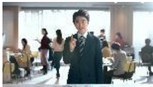
サラリーマン男性客: ホットコーヒーひとつ