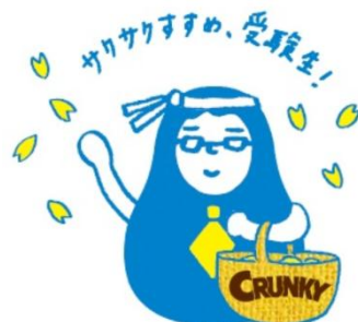
「クランキーダルマはかせ」

明光義塾の人気キャラクター・ダルマはかせとクランキーがコラボレーションした「クランキーダルマはかせ」を作成。パッケージや店頭で使用する販促資材にデザインして盛り上げます。