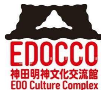
ロゴデザイン 世界株式会社 (CEKAI)