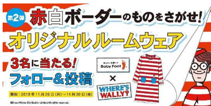
Twitter キャンペーン画像