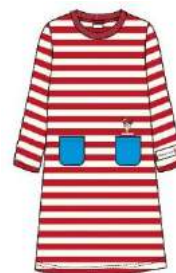
オリジナルルームウェア イメージ画像