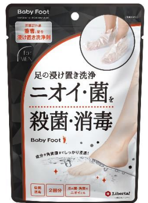
ベビーフット 重曹浸け置き洗浄剤（メンズ）