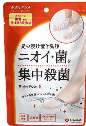
ベビーフット 重曹浸け置き洗浄剤

「ベビーフット 重曹浸け置き洗浄剤」は、30分～60分足を浸け置きすることで、爪の隙間や指の間、角質層まで成分がしっかり浸透。デオドラント剤では防ぎきれないしつこいニオイや雑菌を洗浄できます。また、雑菌が汗や皮脂を分解することで発生し、洗うだけでは落ちにくいニオイの原因の1つである「イソ吉草酸」対策に相性の良い「重曹」を配合。角質層までしっかり浸透して、こびりついたニオイまでしっかりと消臭します。