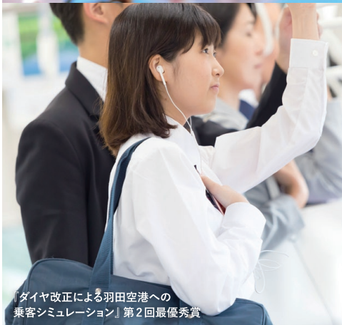
『ダイヤ改正による羽田空港への 乗客シミュレーション』第2回最優秀賞