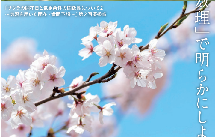
『サクラの開花日と気象条件の関係性について2 ～気温を用いた開花・満開予想～』第2回優秀賞