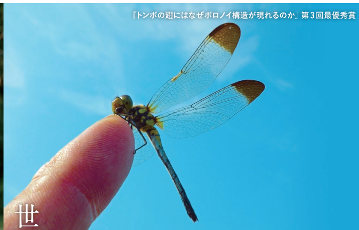
『トンボの翅にはなぜボロノイ構造が現れるのか』第3回最優秀賞