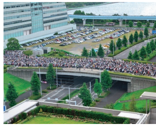
コミックマーケット86の会場へ入場していく人の行列

行列において、最後尾の人が最も早く行列の先頭の位置に到達するような最適な並び方を調べるために、行列の中を人が歩く状況を数理モデルによって記述し、数理モデルの解析から、最適な並び方が存在することを明らかにした。参考文献に記載されている具体的な数値を代入することで、行列内での並び方は前の人と0.62m空けて並べばよいことがわかった。