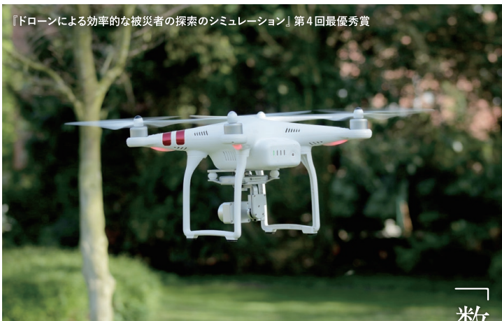
『ドローンによる効率的な被災者の探索のシミュレーション』第4回最優秀賞