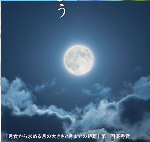
『月食から求める月の大きさや月までの距離』第1回優秀賞