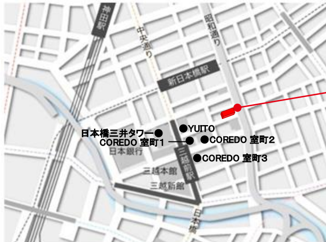
日本橋ライフサイエンスビルディング