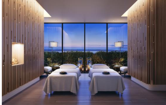
スパトリートメントルーム

白砂輝くビーチと「ハレクラニ」の象徴オーキッドマークを約 150 万枚のモザイクタイルで表現したプールなどタイプの異なる屋内外 5 つのプール、天然温泉を利用した温浴施設を備えた国内トップレベルのスパなど、充実した施設構成により、これまでにない多彩でラグジュアリーな滞在体験をご提案いたします。