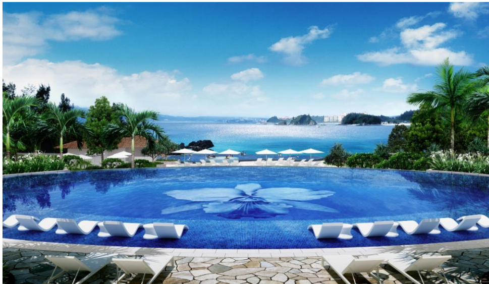
オーキッドマークを配したプール

「ハレクラニ沖縄」は、ハレクラニが築いてきた伝統と精神を継承しつつ、豊かな自然、文化など、沖縄の魅力を存分に生かすことで、唯一無二のラグジュアリーリゾートを目指してまいります。“またここに帰ってきたい”と思っただけのような空間・ホスピタリティをご用意して、皆様のお越しを心よりお待ちしております。