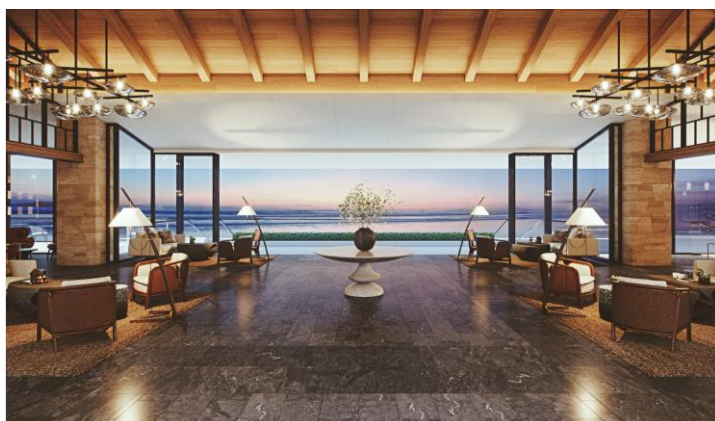
夕景を望むロビー

ビーチリゾートでありながら豊かな沖縄の樹々に囲まれ、波音が聴こえると同時に煌めく海と緑が目飛び込んできます。リゾートに到着した瞬間に、日常から完全に隔絶され、心安らぐ気持ちになっていただけます。また、水平線の彼方へと太陽が沈みゆく夕暮れのひとときでは、煌めく海原と潮騒がかつてない高揚を与えてくれます。