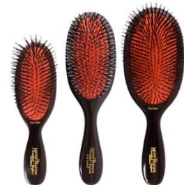
メイソンピアソン 国内唯一の正規販売代理店をつとめる、英国伝統のハンドメイドヘアブラシ