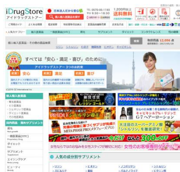
iDrugStore 世界の最新の治療薬と健康商品を販売