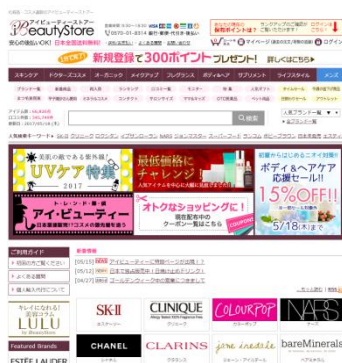
iBeautyStore 有名ブランドやレアものコスメまで幅広いラインナップの商品を販売