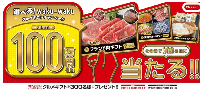
『選べる！waku-wakuグルメギフトキャンペーン』店頭POP

三菱ケミカル株式会社(本社:東京都千代田区、社長:和賀昌之)のグループ会社である、浄水器の販売を行う三菱ケミカル・クリンスイ株式会社(本社:東京都品川区、社長:木下博之 以下、当社)は、年末年始の家庭における浄水器カートリッジの交換を促進するため、クリンスイ ※1 指定商品を対象とした『選べる！waku-wakuグルメギフトキャンペーン』を2018年10月から2019年1月末まで実施します。