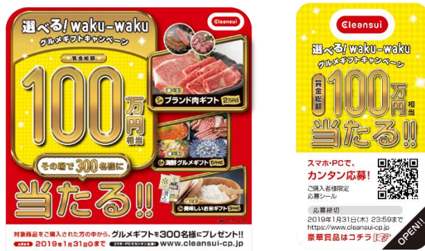
『選べる！waku-wakuグルメギフトキャンペーン』 キャンペーンPOP(左)と、キャンペーンシール(右)