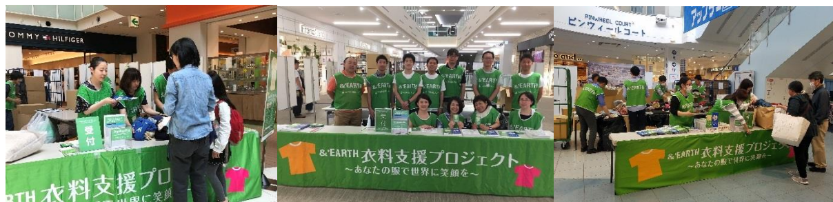
2018年5月(第19回)実施時の様子

当社グループの商業施設では、「Growing Together」の事業理念に基づき、地域のお客さまとともに成長し、ともに豊かになる社会をめざして、環境推進・社会貢献活動を続けてまいります。