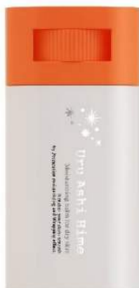
うるアシ姫 容器パッケージ