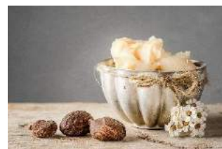
シアバター イメージ画像

また、外部刺激によるお肌のダメージを抑え、摩擦による粉ふきを防止するので、潤いを保ちしっとりとしたお肌に導きます。