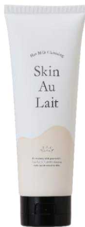
商品パッケージ画像

https://fan.liberta.net/item/nonplex/other/skin-au-lait/11713/