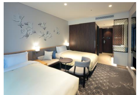
【客室/ツインルーム】

・バスルームはトイレと分離させ、ゆったりと寛げる独立型で、小さなお子さまも安心してご利用いただけます。