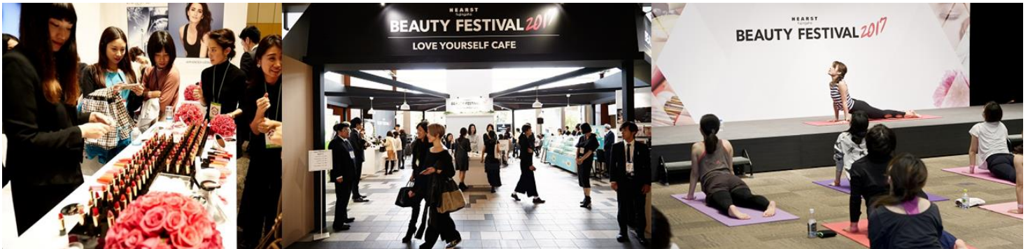
「ハースト ビューティ フェスティバル 2017」の様子

2018年10月13日(土)東京ミッドタウン ホール&カンファレンス・アトリウムにて チケット(無料・有料)申し込みスタート