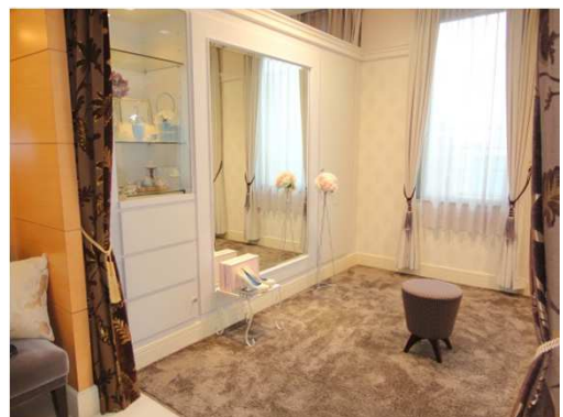
体験開催予定の本店3F