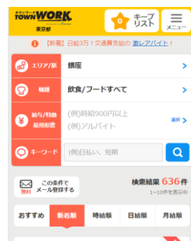
▲『タウンワークネット』検索ページ

※アルバイト情報サイトを運営する62社を対象に、過去5年以内にアルバイト情報サイトに掲載された求人に応募し、アルバイト・パートとして就業した経験をもつ7,514人において、アルバイト情報サイト利用における顧客満足度を調査（2018年6月1日、株式会社oricon ME発表）