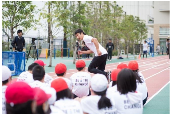
第5回/陸上アカデミー