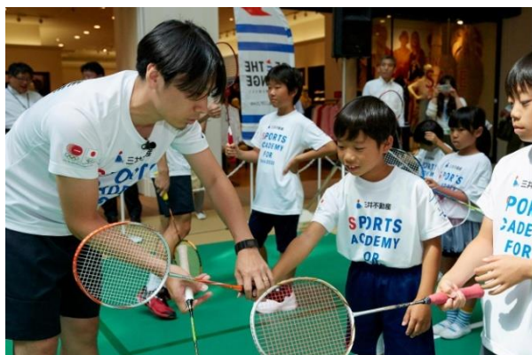
第2回/バドミントンアカデミー