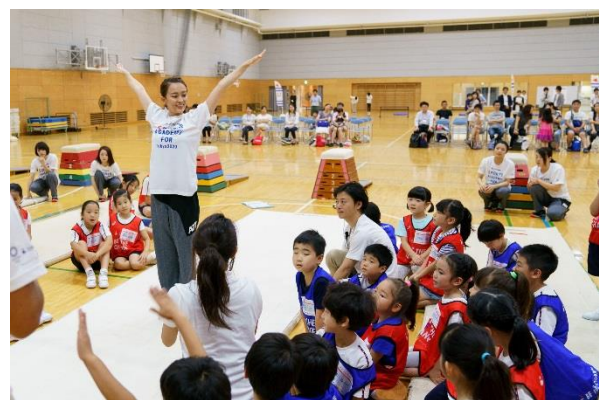
第9回/体操アカデミー