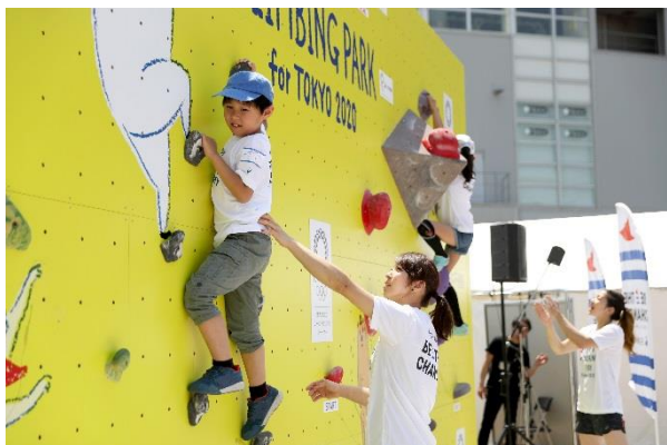
第7回/クライミングアカデミー