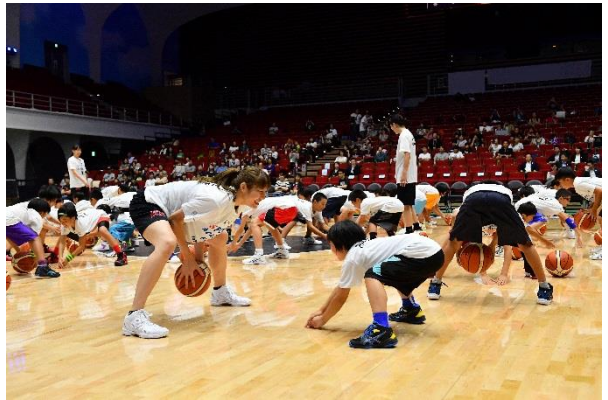
第10回/バスケットボールアカデミー