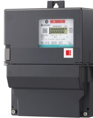
スマートメーター画像