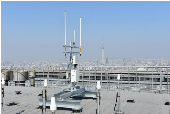
日本橋三井タワーに設置したゲートウェイ（アンテナ）