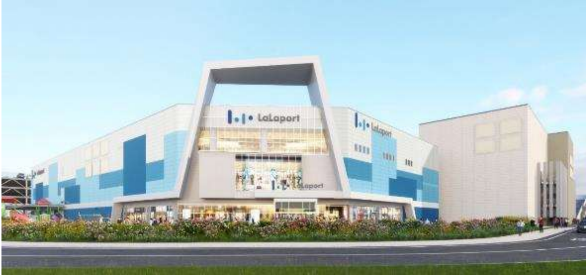
「(仮称)三井ショッピングパークららぽーと沼津」南側外観イメージ