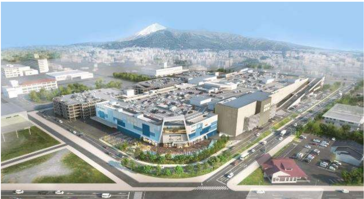
「(仮称) 三井ショッピングパークららぽーと沼津」建物全体イメージ