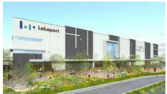
北側外観イメージ

デザインコンセプトは“Meet Urban Meet Nature”とし、洗練された都会の高揚感と豊かな自然がもたらす安心感に包まれた新たな施設(空間)が誕生します。外観には、施設の背後にそびえる富士山を思わせるキャノピーを採用、色彩計画は、アクセントカラーを配し、施設の視認性および認知度を高め、お客様の記憶に残るデザインとします。モール内部も建物やランドスケープ(外構)との調和を意識し、賑わいやワクワク感に加え、いつも来たくなるような快適な空間をデザインします。