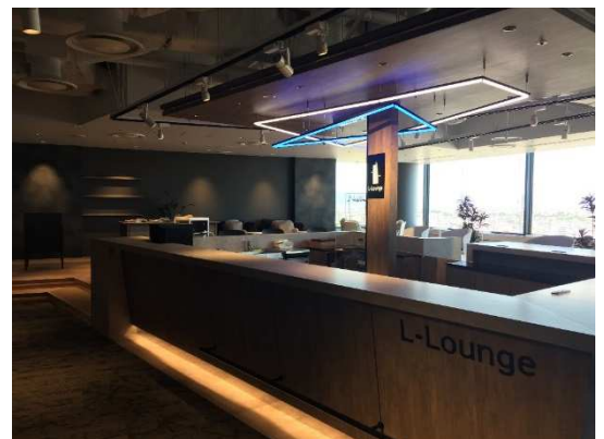
コンシェルジュが常駐する受付

しかし、竣工した2007年以降、現在に至るまでに、名古屋駅周辺のオフィス事情は大きく変化しています。2027年のリニア開業を見据えて、名古屋駅周辺エリアは再開発の動きが加速しており、オフィス需要も高まっています。2018年3月時点の「大規模ビル」の空室率は3.0%とほぼ満室状態となっており、1997年11月に記録した最低値2.8%に迫っています *1 。これらの背景から、ビジネス拠点としての名古屋ビジネスエリアの重要性とポテンシャルは、今後も上昇を続けていくことが予想されます。