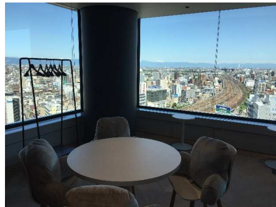
名古屋の街を見渡しながらかち合わせも可能