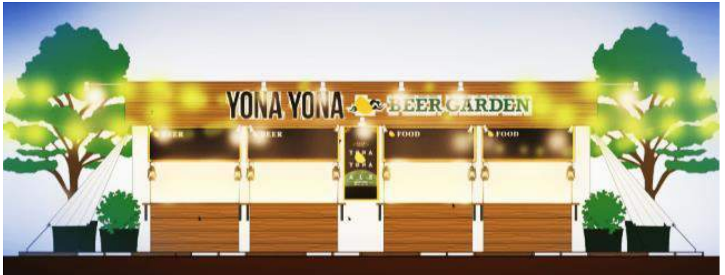
「グランピング」をイメージしたテント風のビール・フード提供スペース（イメージ）

2018年6月8日（金）～9月2日（日）、アークヒルズ アーク・カラヤン広場（港区赤坂）に、「YONA YONA BEER GARDEN in ARK Hills」をオープンします。よなよなエール公式ビアレストラン「YONA YONA BEER WORKS」がプロデュースした、ヤッホーブルーイングの6種類のクラフトビールがドラフトで楽しめるビアガーデンです。代表ブランドである“よなよなエール”をはじめ、このビアガーデンのために特別に醸造した『ARK Hills Ale 2018』をご用意します。