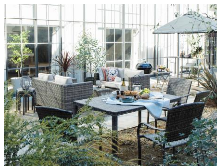
テラス家具「PATIO PETITE パティオプティ」

ウェルビーイングなライフスタイルをご提案するナチュラルライフリビングのコーナーでは、バルコニーでも使える「アウトドアファニチャー」や最新調理家電を使った絶品レシピ、ヘルスケアフードなどをご紹介します。