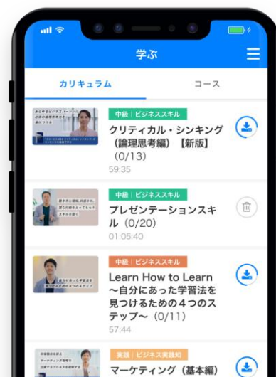
スマホ画面イメージ

動画は、2018年4月24日時点で1500本以上。グロービス法人研修部門およびグロービス経営大学院のビジネスリーダー育成のノウハウを結集し、マネジメントやリーダーシップに関する幅広いビジネスナレッジを学ぶことができます。学習コースの間には500本以上のテストを用意。理解度の確認や復習に役立てることができます。