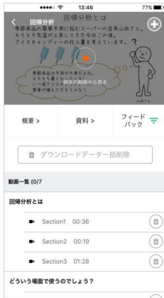
動画ダウンロード機能