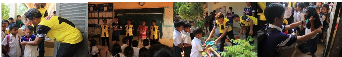
カンボジアでの寄贈の様子(2018年3月)