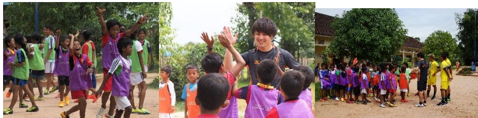
カンボジアでのサッカークリニックの様子(2017年7月)

概要 ソルティエロの海外拠点スタッフや選手の協力により、サッカー用具の寄贈に加えて子供たちにサッカーの基本技術やチームワークの大切さを伝え、学びの機会を提供してまいります。