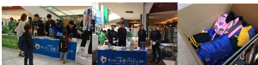
第2回の各会場でのサッカー用品回収の様子

実績の詳細については JRCC HP ( http://www.jrcc.or.jp/ ) にてご確認頂けます。