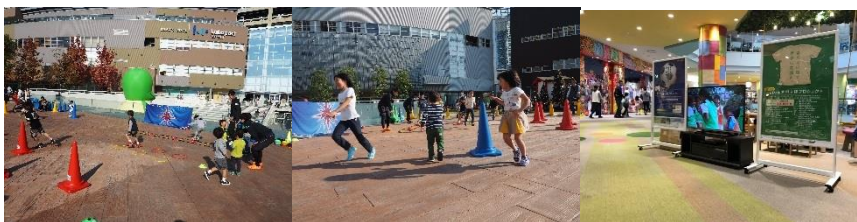
第2回の各会場でのイベントの様子